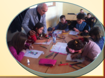
Kolektivi i shkollës