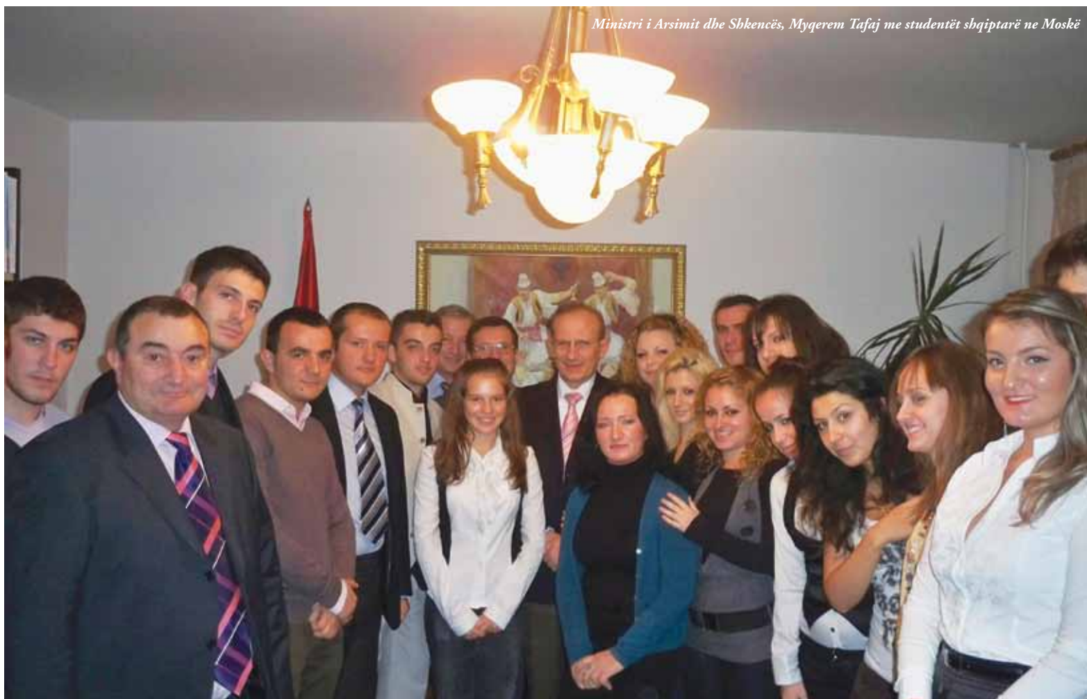
Ministri i Arsimit dhe Shkencës, Myqerem Tafaj me studentët shqiptarë në Moskë

Ministri i Arsimit dhe i Shkencës, z. Tafaj, pati takime të shumta me homologë të tij, me Drejtoren e Përgjithshme të UNESCO, Znj. Irina Bokova dhe me përfaqësues të organizatave që ndihmojnë në fushën e arsimit. Ministri Tafaj u ftua nga shumë homologë për të vizituar vendet e tyre me qëllim shkëmbimin e përvojave në fushën e arsimit.